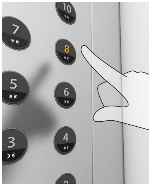
プッシュ式ボタン一体型のイメージ

非接触ボタンの普及を通じて、利用者の皆さまが快適に安心して利用できる移動空間の提供を目指します。