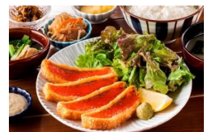
銀王レアカツ定食 1,200円