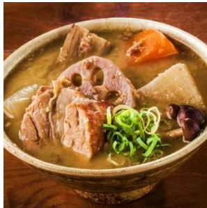
たっぷりゴロゴロの食べ応え具材と優しい汁 名物 とん汁 ¥400