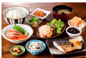
つかだ食堂の小鉢御膳 1,500円