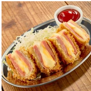
スパムの塩味がお酒のアテにもおかずにも◎ パムカツ ¥580