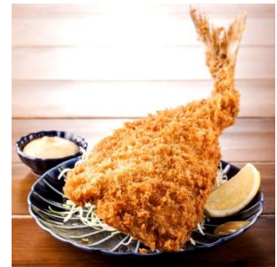
シェアしても満足いくほどの大きさ！ アジフライ XL ¥680