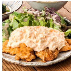
タルタルも丁寧に店仕込み 若鶏のチキン南蛮 ¥580