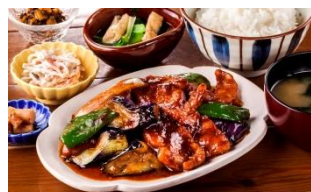
豚の茄子味噌炒め定食 900円