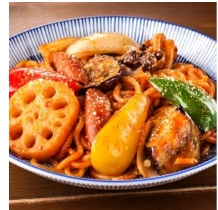
野菜たっぷり！太麺で懐かしの味 スパゲッティナポリタン ¥740