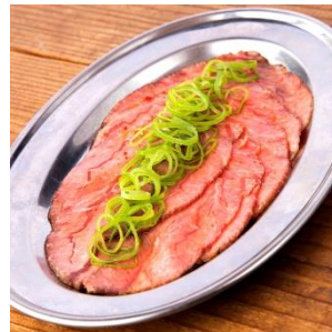
低温調理でしっとりやわらか 牛ホホたたき日向夏ポン酢 ¥680