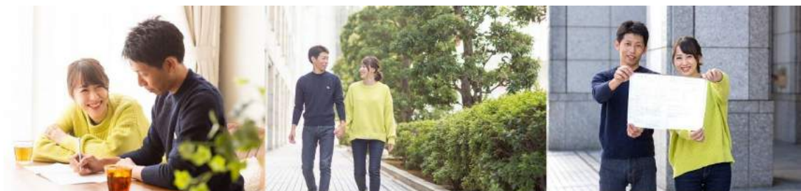
エニマリ 『エニマリの婚姻届フォト』

ふたりで婚姻届に記入する様子、婚姻届を提出しに役所に向かって歩くふたりの姿、役所に着いて婚姻届を提出する瞬間、提出を終えて晴れて夫婦となったふたりの表情など、カップルが入籍するまでの一瞬一瞬をプロカメラマンが撮影することで、何年経っても見返したくなる思い出の写真に収めます。プロカメラマンの撮影と写真70カットが付いて、30,000円（税抜）でご提供します。