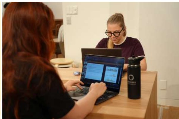
Students attending online classes