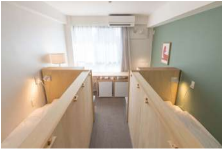
Double room for two residents

Common areas feature lounges, shared kitchens, and shared bicycles. In line with Minerva's curriculum, the main lounge has been expanded by combining a former nap room with an adjacent stairwell landing, creating a large space suitable for both group work and individual study, as well as dining and social gatherings. Future plans also include adding a sauna and large communal bath to further enhance cultural experiences for students.