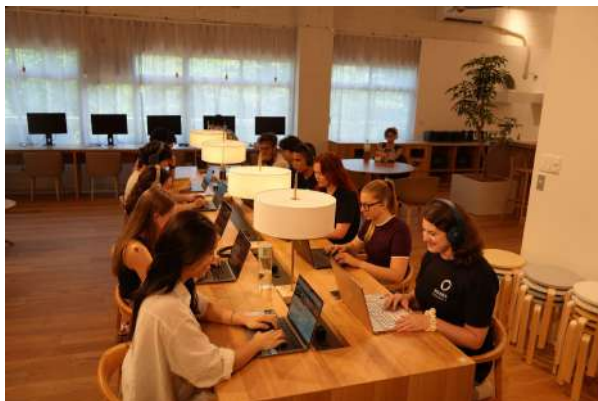
Students studying in the lounge