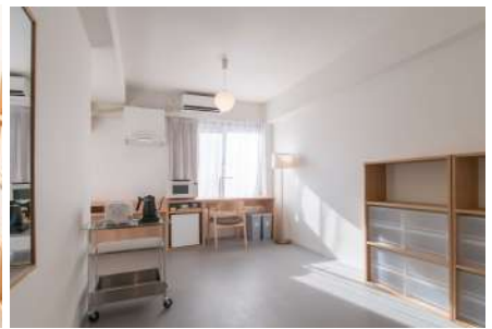
universal room (barrier-free design)