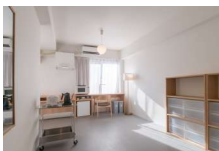
広々としたユニバーサルルーム