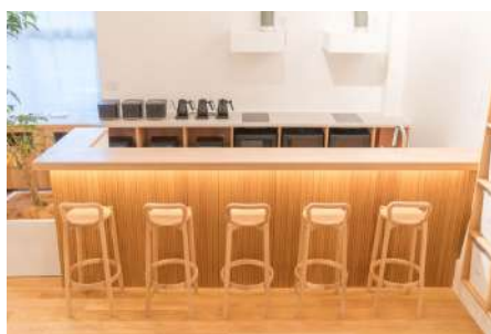
皆で集えるシェアキッチン