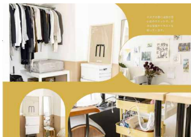
goodroom residenceに住む方のお部屋