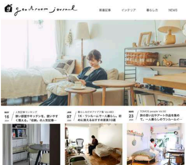
ライフスタイルメディア「goodroom journal」

https://livingpass.goodrooms.jp/topics/88