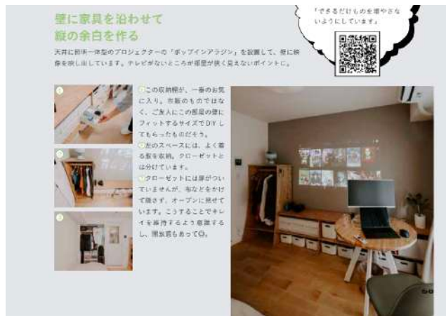
TOMOSに住む方のお部屋

誌面には、グッドルームが展開する無垢床リノベーションブランド「TOMOS（トモス）」や、敷金礼金0・家具家電付きのサブスク型賃貸「goodroom residence」に実際に住んでいる方の実例も多数掲載しています。インテリアのアイデアとしてはもちろん、理想の暮らしをイメージするための「お引越し前の物件選びの参考」としても、ぜひご活用ください。