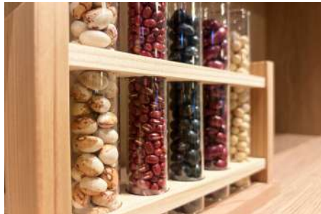
道産の名産豆サンプルの展示も