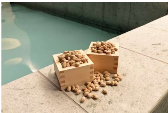
やわらかな湯あたりの豆乳風呂