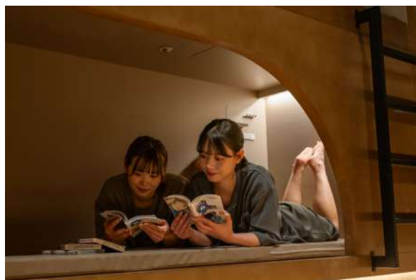
人気漫画を約1,000冊増加