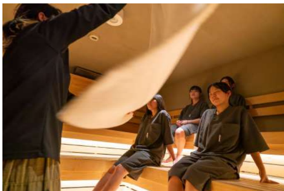
節分×サウナをお楽しみください