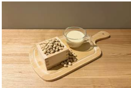
限定の豆乳ドリンク※写真はイメージ