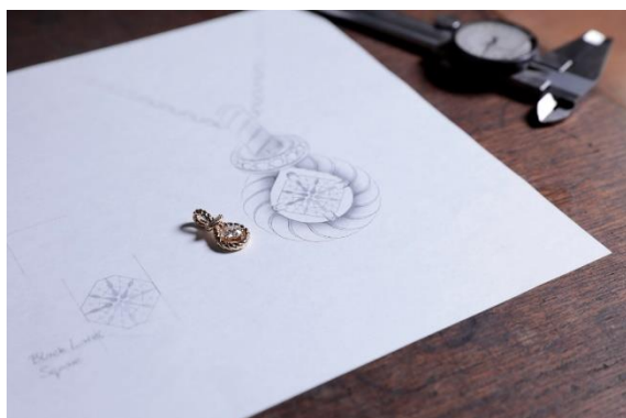
贈呈ジュエリー制作風景