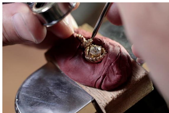
贈呈ジュエリー制作風景