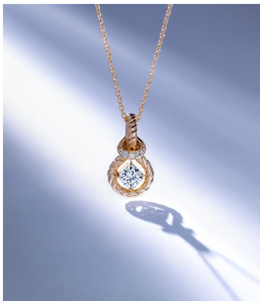
贈呈されたフォーエバーマーク エンコルディア® コレクション “Tight Knot”の特別版ペンダント

これからの抱負を問われると、「フォーエバーマークと出会ってからこれまでの10年、仕事を続けられたことは恵まれていたと感じます。10年後も、様々な方とのご縁をいただくために、今回の受賞を日々の糧として、一日一日、人として年輪を重ねていきたい。」と語りました。