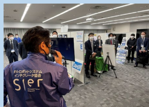
開会のあいさつ (朝礼)

協会にて年2～3回発行している会報誌「JARSIA」へ出展製品情報を広告サイズで掲載します。広告料は出展料に含まれます。また製品情報の「フラッシュ動画」は協会ホームページで公開し、また当日配布チラシにも閲覧QRコードを掲載、いつでも閲覧可能としています。