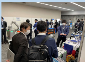
熱心な説明に聞き入る