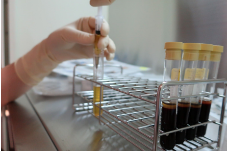
多血小板血漿 (PRP) を採り出し抽出する

当院では、糖尿病や肝臓疾患の患者へ、本人の血液や脂肪の中から再生力のある細胞を取り出して培養し患部に戻すことで治癒を促す幹細胞治療を提供します。関節を痛めた患者へは、本人の血液から多血小板血漿を抽出しそれを患部へ注射するPRP治療を行います。ほかにも、糖尿病、肝臓疾患、ひざの痛み、股関節の痛み、肩の痛み、スポーツ医療、肌の再生医療、毛髪再生医療（AGA）、免疫再生医療などの治療を幅広く提供します。