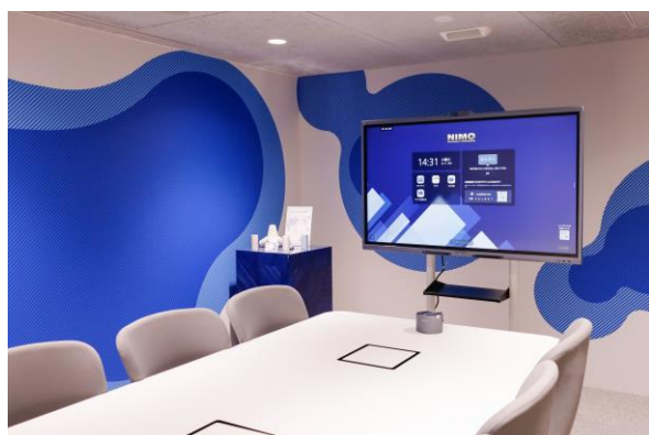
▲ point 0 marunouchi

ITで会議DXを支援するナイスモバイル株式会社（本社：長野県松本市、代表取締役社長：高学軍）は、株式会社オカムラ（本社：神奈川県横浜市、代表取締役社長執行役員：中村 雅行）との会議DXに関する共同実証実験に向け、株式会社オカムラが出資する株式会社point0（所在地：東京都千代田区、代表取締役社長：石原 隆広）運営のコワーキングスペース「point 0 marunouchi」に、世界シェアNo.1(*1)の電子黒板、MAXHUB「All in One Meeting Board V7シリーズ」55型を2025年1月21日(火)に導入いたしました。また同目的で、株式会社point0が施設運営ならびに共創活動支援を行う「terminal.0」へもMAXHUB「All in One Meeting Board V7シリーズ」86型を2025年1月24日(金)、導入いたしました。*1 Futuresource調べ / 2023 (公式サイト： https://nicemobile.jp/news/250212/ )