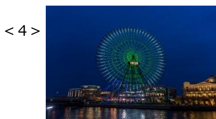
<1>2023WMHD告知ポスター <2>2022東京タワー <3>2022さっぽろテレビ塔 <4>2022よこはまコスモワールド

世界メンタルヘルスデーは、世界精神保健連盟によって制定され、世界保健機関（WHO）もサポートする国際記念デーです。メンタルヘルス（精神的健康）への認識を高め、偏見をなくすことを目的に世界60か国以上で啓発活動が行われています。