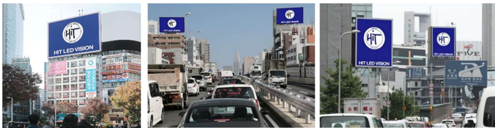
『DOOH サブスクリプション』サービス対象メディア（左から）

本プランを利用いただけるのは、1) 渋谷スクランブル交差点に面する超大型屋外広告ビジョン『シブハチヒットビジョン』、2) 渋谷宮益坂下エリア全7面で構成され常時シンクロ放映を行う『シンクロ7シブヤヒットビジョン』、3) ビジネス、ショッピング、カルチャーの集積する池袋駅東口に昨年11月に新設された『池袋ヒットビジョン』、4) 首都高速道路を全13面で網羅する日本最大級のネットワークビジョン『首都高速デジタルLEDボード』、5) 西日本随一の交通量を誇る新御堂筋に4連続で設置されたネットワークビジョン『新御堂筋デジタルLEDボード』の全5メディアです。