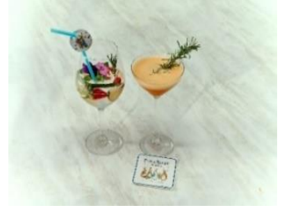
▲スペシャルドリンクイメージ