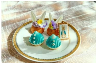
▲スタンド下段イメージ