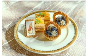
▲スタンド中段イメージ