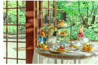
▲アフタヌーンティーイメージ

エルダーフラワーポタニカルトニック(ノンアルコール)/キャロットカクテル(アルコール)