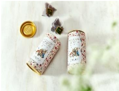
▲ピーターラビット™ オリジナル ギフトブレンドティー イメージ