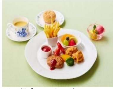
▲お子様プレートイメージ