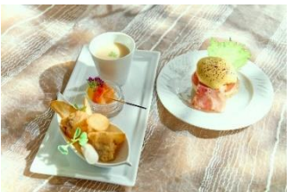
▲セイボリーイメージ