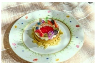
▲スペシャルティイメージ