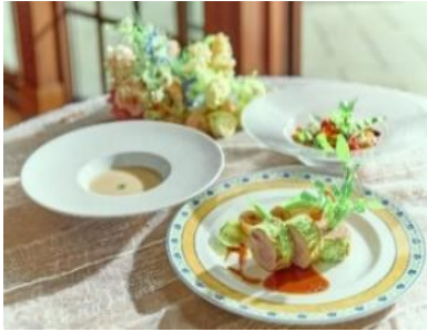
▲ランチコースイメージ

ピーターラビット™ オリジナルギフトブレンドティー 2,000円 *ルピシアとの共同開発により作成 https://www.lupicia.com/