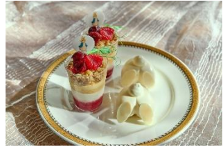
▲スタンド上段イメージ