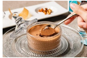
とろりと滑らかなチョコプリン