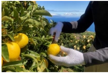
伊豆産ニューサマーオレンジ

ローストした後にキャラメルでコーティングしたナッツは、チョコレートの味や深い香りと相性がぴったり。カリッとした食感は、滑らかなプリンのアクセントにもなります。