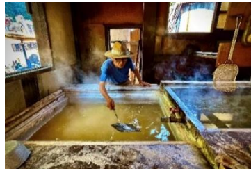
3 段釜で作る河津の海の塩