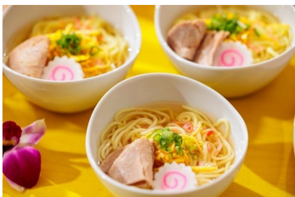
▲サイミン アーカラ風(ハワイ風ラーメン)