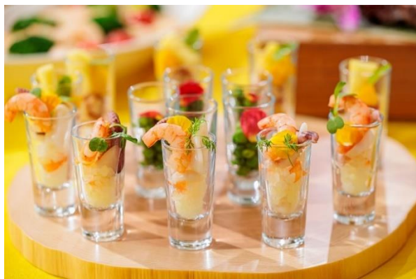
▲海の幸のロミロミ