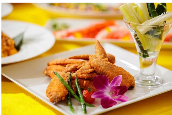
▲バッファローチキンウイング アーカラ風