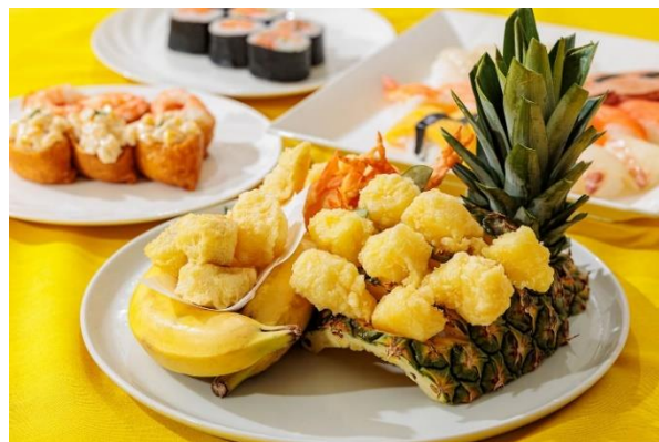
▲バナナとパイナップルの天婦羅