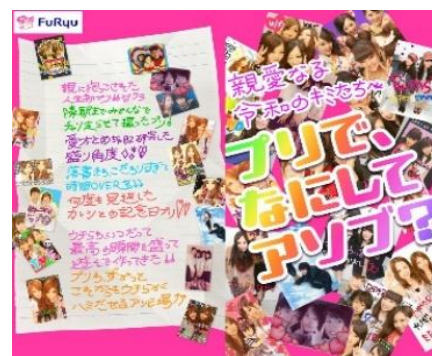
プリ 30 周年記念特設サイトイメージ