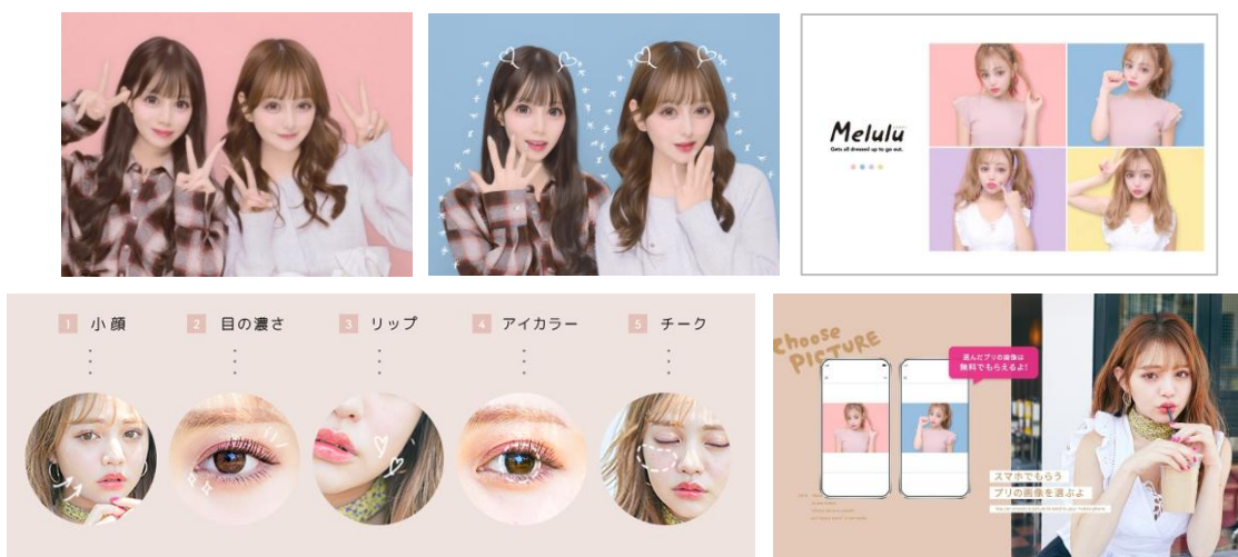
『Melulu』モードで楽しめるコンテンツイメージ 『Melulu』ならではの“ピュア盛れ”な写りとカラフルな背景での撮影が楽しめる

ずるくらい可愛い“ピュア盛れ”な写りとカラフルな撮影背景で多くのユーザーを虜にし、昨年 2024 年、多くのユーザーに惜しまれつつサービスを終了した『Melulu』。本モードでは、令和の女子高校生・大学生に愛された“うるうるおめめ×やわマツト肌”の『Melulu』独特の盛れ感を復活させました。画面デザインやスタンプ、シール印刷時の仕上がりなど細部まで忠実に再現した、ファン必見の内容となっております。