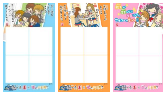
コラボシールデザイン