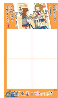
懐かしの盛り感や落書きが楽しめる「ウチらの伝説プリ」仕上がりがイメージ