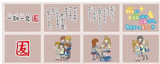
コラボスタンプ例と使用イメージ