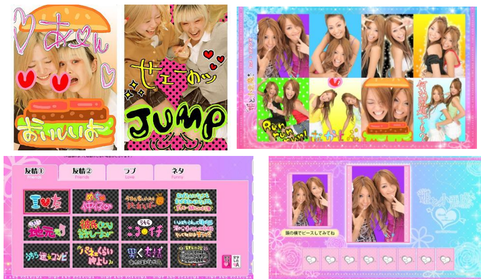
「姫と小悪魔」モードで楽しめるコンテンツイメージ。 平成を存分に感じられる懐かしさ溢れる写りやデザインが魅力

約 20 年前の“平成ギャル”を象徴するプリ機をお楽しみいただけます。写りは、平成特有の画質の粗さや色味、加工感の少なさなどを忠実に再現。また、りんごやハンバーガーに挟まれたようなプリが撮れるフレームや、体に沿ってキラキラやドットなどが付くオーラ背景、当時流行していた「めっちゃ仲仔」「うちらニコイチ」といったメッセージスタンプなど、平成ならではの懐かしさと可愛さを存分に感じられるコンテンツが魅力です。また、落書きタブにはこの頃のプリ機に搭載されていた裏ワザ機能や、ワンタップで当時のプリを再現できる一発落書き機能もご用意しました。