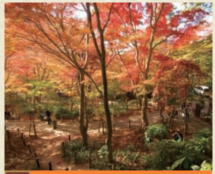
IV 瑞宝寺公園の紅葉

【駅から徒歩約18分】 滝に続く道は紅葉や楓が覆われ紅葉のトンネルが迎えてくれます。