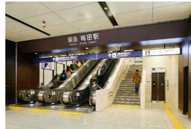
GATE（1階～3階を結ぶ階段、エスカレーター・2階中央改札内コンコース）