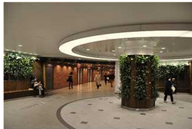
APPROACH（JR高架下通路・1階東西方面通路）