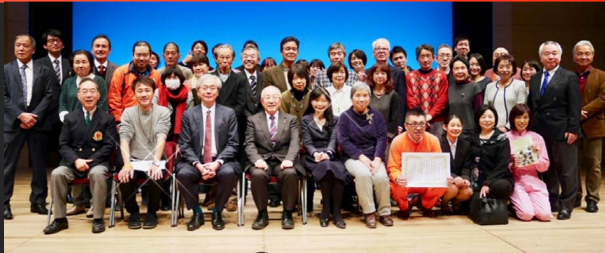
昨年の表彰式。受賞団体が舞台上に勢揃い

表彰団体の活動について、丁寧に紹介する表彰式とともに、選考委員が「認知症とともに生きるまち」とはどんなものかを、語り合う記念シンポジウムを行います。