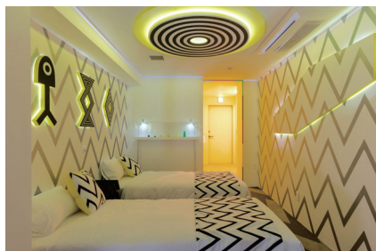
BnA HOTEL Koenji

アートとビジネスの新たな関係性を模索するクリエイティブプロダクション。宿泊型アート作品を客室としたBnA HOTELや、街全体にアートを飾る壁画プロジェクト、その他アートを軸とした内装設計、プロモーション企画やイベント企画などを手掛ける。BnA HOTELはホテルブランドとして現在、高円寺、秋葉原、京都の3拠点を運営しており、今回の日本橋のBnA_WALLも含め、今後も国内外に拠点を展開する予定。各拠点がアーティスト、旅人、ローカルが交わるコミュニティのハブになっている。BnA株式会社 [ www.bna-corp.com ] | BnA HOTEL [ www.bna-hotel.com ]