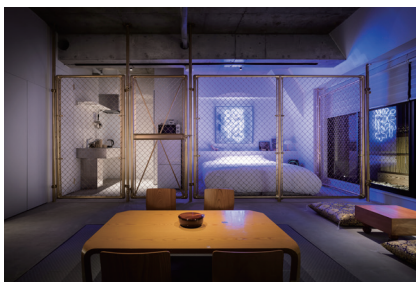
BnA STUDIO Akihabara