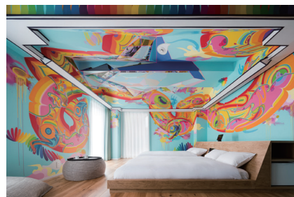
BnA Alter Museum