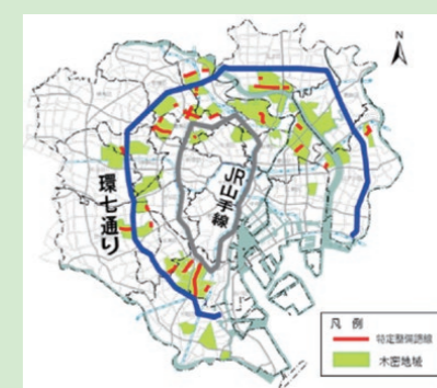
震災時に特に甚大な被害が想定される木密地域(整備地域 約6,500ha(緑色箇所))

都は、首都直下地震の切迫性などを踏まえ、木密地域における都民の生命と財産を守るため、木密地域を燃え広がらない・燃えないまちへと造り変えています。