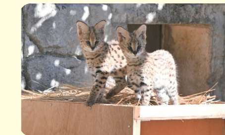
写真:サーバルの子ども (撮影日:2022年12月14日)

令和4(2022)年10月に多摩動物公園で生まれたサーバルの子どもです。ぜひ会いに来てください。