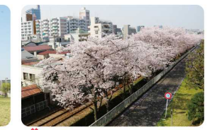
三河島水再生センター前