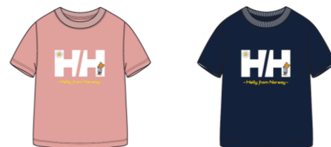
K HH Helly Bear Tee (HJ62032) : ¥4,180 [税込]

[COLOR : ホワイト・サクラ・ヘリーブルー] SIZE : 110・120・130・140