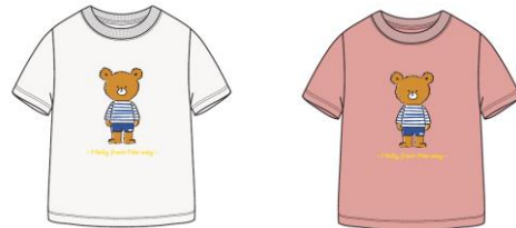
K Helly Bear Tee (HJ62031) : ¥4,180 [税込]

[COLOR : ヘリーブルー・ホワイト・サクラ] SIZE : 110・120・130・140