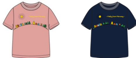
K Helly Bear SUN Tee (HJ62030) : ¥4,180 [税込]

[COLOR : ホワイト・サクラ・ヘリーブルー] SIZE : 110・120・130・140