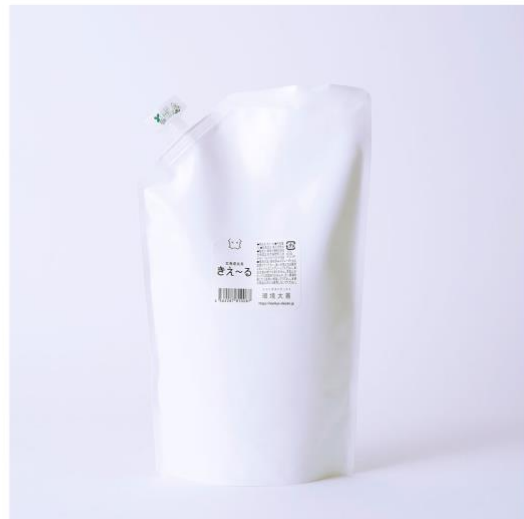
左：きえ〜る(400mL ボトル) 右：きえ〜る(1L 詰替パウチ)