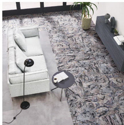
GT-1003 「ROCKS」 隆起した岩肌をリアルに表現

同企画では、3つの個性的なタイルを使った空間づくりのヒントとして、建築家の寶神尚史さん、スタイリストの今吉高志さんによるコーディネート例を掲載。“都会のヴィラ”をイメージした、極上のリラックス感を体験できる空間を提案します。中でも、スタイリング紹介ページ「Scraps of ideas」では、絶景×日常をもっと楽しくするためのアイデアを掲載。空間デザインのポイントを施工例写真と併せて紹介します。