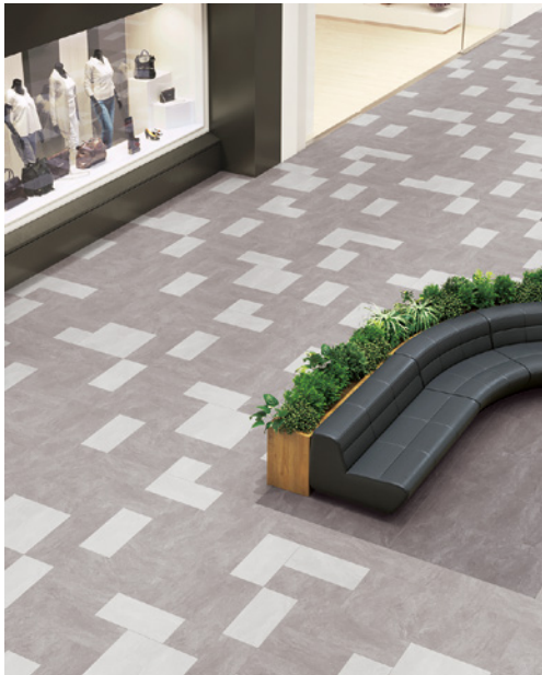
IS-1001-A/B/F・1003-A/B/F・1004-A 「モルテストーン」デザイン貼り