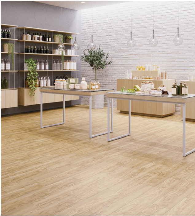
WD-1099 「オリーブ」 施工例 オリーブ材特有のマーブル模様の板目をリアルに再現

同見本帳では、プリントタイルならではのユニークな木目デザインを多数収録。幹が細く現実には床材向けに加工しにくい「オリーブ」をモチーフにした商品や、デザインの面白さから海外で人気の「焼杉」など、個性豊かな商品を掲載します。また、石目柄では、空間に広がりを持たせる 914.4mm角・609.6mm 角の 2 サイズで展開する「ワイドモルタル」などの大判タイルを収録するほか、ベーシックで使いやすい「モルテストーン」を 4 サイズ ×4 配色で展開し、多様なデザイン貼りによる空間コーディネート提案。見本帳紙面では 12 パターン、連動する WEB ページと合わせて合計 65 パターンのバリエーション豊かなデザイン貼りを紹介します。