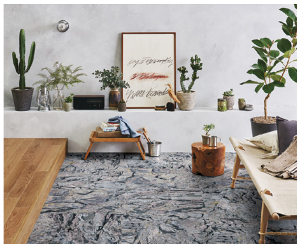
GT-1003 「ROCKS」 スタイリングポイント

1975年神奈川県生まれ。明治大学大学院理工学部建築修士課程修了。青木淳建築計画事務所勤務した後、2005年に日吉坂事務所を開設。個人住宅から店舗設計の商空間など幅広く手掛ける。