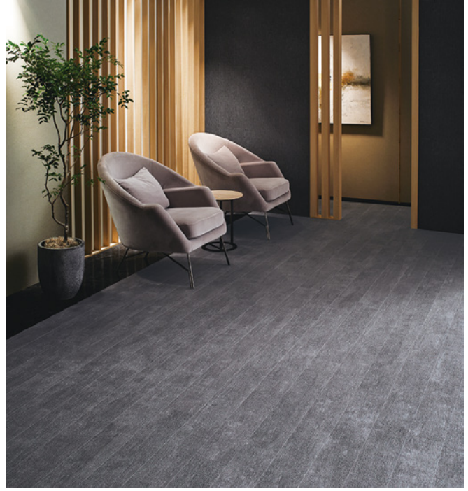
WD-1121 「焼杉」 施工例 炭化させた杉板の表面の凹凸を緻密に表現