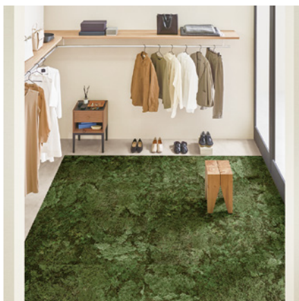
GT-1002 「FOREST」 上空から見下ろした森林の風景を表現