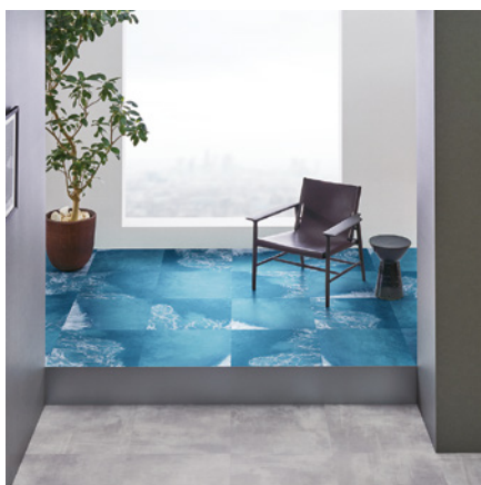
GT-1001 「WAVES」 さまざまな波の表情をランダムに表現

巻頭企画「Landscape A BIRD'S-EYE VIEW.」は、大空を自由に飛び回る鳥たちの目線で捉えた絶景をテーマにデザインしたコレクション。躍動的な白波や海の青さを表現した「WAVES」、緑豊かな森林を表現した「FOREST」、隆起したダイナミックな岩肌を表現した「ROCKS」など、自然をそのままに残した表情が印象的な、今までにないフロアタイルです。