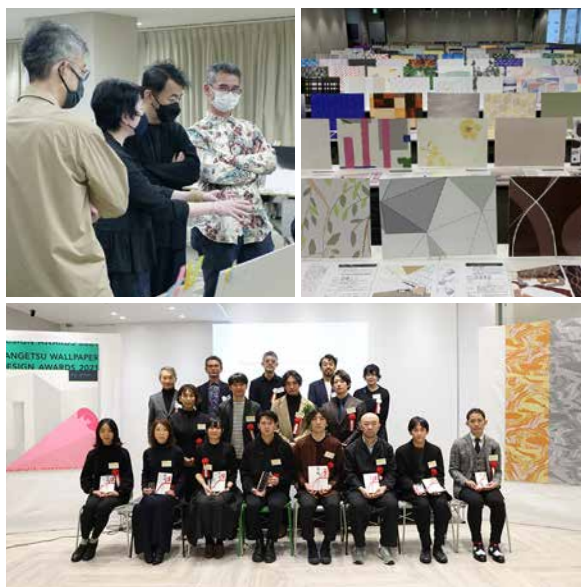
「第5回 サンゲツ壁紙デザインアワード」の様子

「サンゲツ壁紙デザインアワード」は、ブランド理念『Joy of Design』※をテーマとして、2017年から毎年開催しているデザインコンペティションです。当社は、本アワードを通して、新たなデザインの創出や若手デザイナーの発掘に取り組み、インテリア文化の向上に貢献することを目指しています。