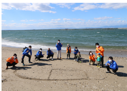
昨年のイベント参加写真