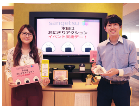
本社社員食堂にて、塩おにぎりを提供