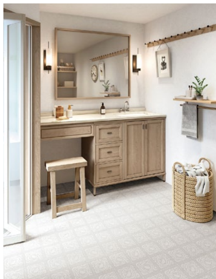
CM-11221 ピュアスクロール

「染める」「削る」「重ねる」の3つの手法をキーワードとして、日本の伝統技法である草木染めや浮造りの木材、繊細で美しいイチヨウの葉の重なりをモチーフに、手作業ならではのぬくもりや奥ゆかしさを感じるデザインに仕上げました。