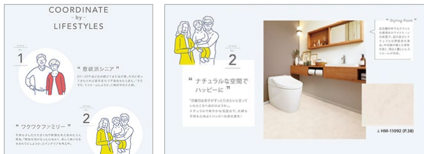
理想の水まわり空間に近づけるスタイリングポイントを紹介

ビニル素材でできたクッションフロアは、耐水性が高いという特長により、トイレや洗面脱衣などの水まわりに多く使用されています。当見本帳では、「Lovin' Our Washroom」と題し、水まわりを好みの空間にするコーディネート企画を掲載。リフォームを検討する“意欲派シニア”、新築を考え始めた“ワクワクファミリー”、ライフスタイルにもこだわる“おしゃれ大好き新婚夫婦”、水まわりにも自分らしさを求める“個性を楽しむ単身者”といったさまざまなライフスタイル例に合わせて、使い勝手がよく心地よい空間づくりを提案します。さらに、よりリアルな水まわり空間をイメージできるよう、最新の水まわり設備やトレンドの間取りを取り入れた施工例写真に一新しました。