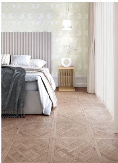
CM-11218 オークパーケット