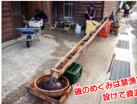
岩海苔の加工(京丹後市丹後町袖志 2021年)