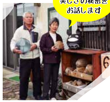
琴引浜の美しさの秘密をお話します