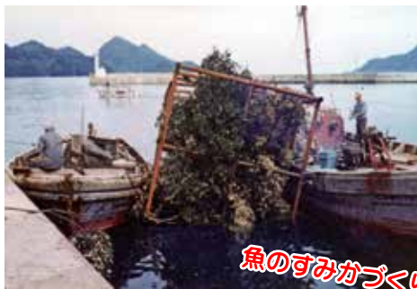
人工漁礁事業(舞鶴市田井 1955~64年代)