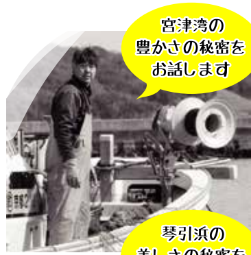
宮津湾の豊かさの秘密をお話します

イベントにおける新型コロナウイルス感染症拡大防止の対策として、イベント当日はマスクの着用、手指の消毒(アルコール消毒液)をお願いします。また、当日参加予定の方で発熱症状がある場合は参加自粛をお願いします。ソーシャルディスタンス確保のため定員を少人数に設定しています。なお、感染状況によってはイベントの開催を中止させていただく場合があります。ご来館前に必ず当館HPあるいはお電話等で開催の有無をご確認ください。