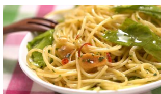
みなさまのお墨付き 【若菜まりえ先生考案】レンジで簡単！ 野菜も食べられるペペロンチーノ

カリスマ主婦として人気を集め、現在は“時短料理研究家”として数々のメディアで活躍中の若菜まりえ先生が考案した、西友の商品を使った時短レシピを紹介。レシピはこちらから https://www.seiyu.co.jp/recipe/