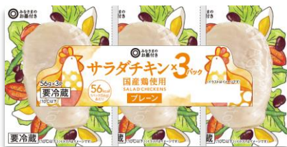
* サラダチキンの画像はイメージです。実際の商品とは異なる場合があります。