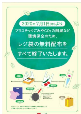
店頭告知ポスター

西友では、地球規模での課題となっているプラスチックごみの問題をはじめとする環境課題の対策の一環として、全店の全売場にてレジ袋の無料配布は6月末までといたします。容器包装リサイクル法の改正により、7月1日からプラスチック製レジ袋の有料化が全国で一斉開始となることにも対応し、すべてのレジ袋をバイオマス素材配合率30% ※1 のものへ切り替え、袋が必要となるお客さまには有料でご提供いたします ※2 。