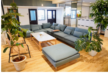
howlive 名護宮里店(名護市)