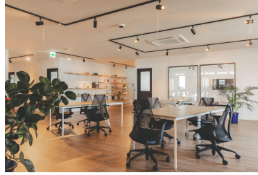
howlive 宮古島店(宮古島市)