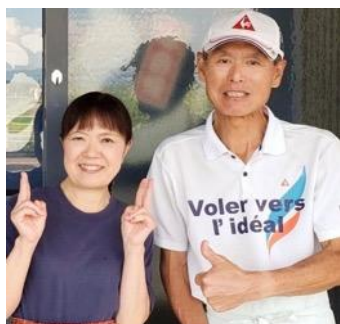
ジャンボうどん高木/高木ご夫妻

21日17時(予定)からはステージにて、提供されるコラボメニュー紹介を各店舗店主さまから行っていただきます。数量限定のこの一杯。このお祭りでしか体験できない、想いが繋がった“師弟”コラボうどんを食べ逃しなく！