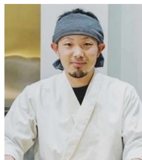
手打うどん竹寅/竹輪さま