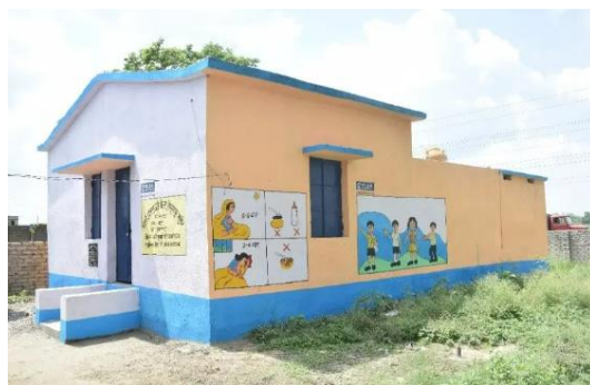
ビハール州に建設した、カラフルなイラストが描かれた幼稚園

あたたかな支援の輪が紡ぐ、希望に満ちた子どもたちの笑顔。その瞳に宿る輝きが、未来を明るく照らす光となる、そう信じて——