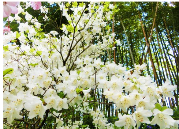
白八汐（しろやしお）