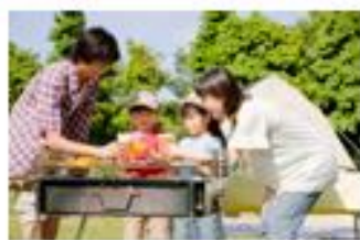
山や海のアウトドア時に