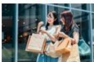
ショッピング時に