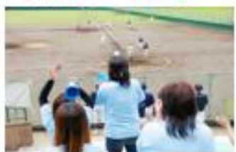
屋外でのスポーツ観戦に