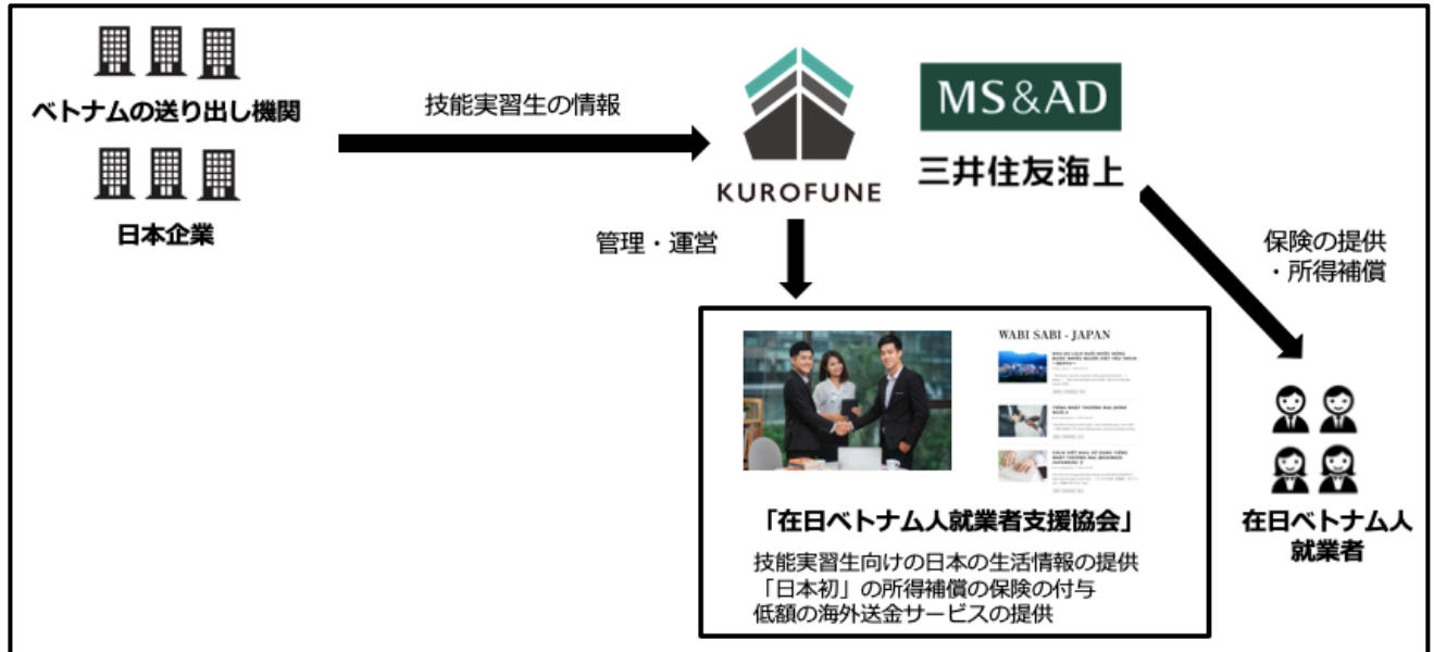
↑ 在日ベトナム人向け所得補償保険のスキーム

管理組合や業界・業種によらずご加入頂け、会費も一律で設定しています。会員の年会費は1万5千円で所得補償保険の月額補償額は最大10万円、総補償額は最大120万円となっています。補償金額は、日本の最低賃金をベースにしています。在ベト協会へのご加入を希望される際は、HPを通じてお問い合わせを頂くようお願い申し上げます。