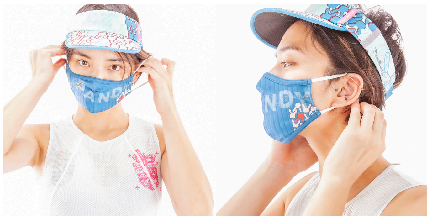
99 Usagi Printed MASK/ネイビー

ランニングウェアのPandaniから発売中のスポーツに最適なデザインマスクが、 80種類越えという圧倒的なデザイン数から選べる!!