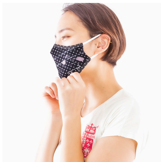
SPRAY Printed MASK