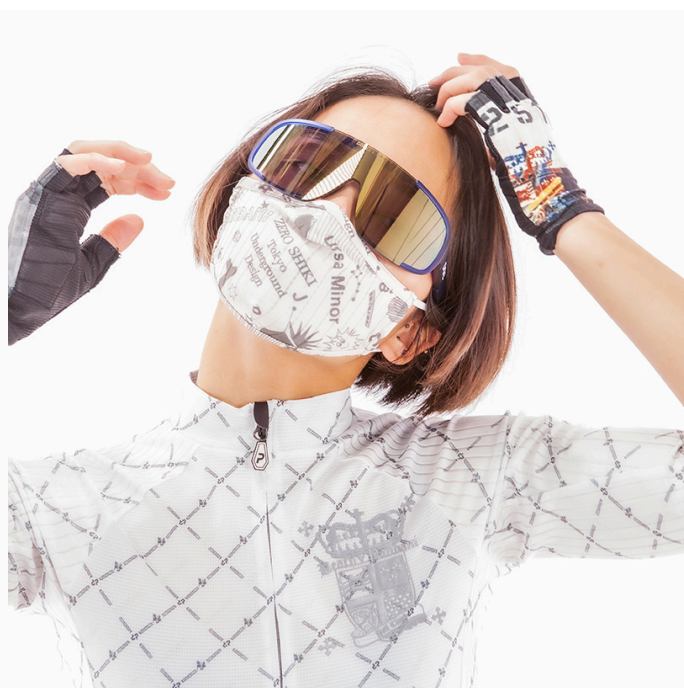
零式 Printed MASK/WHITE