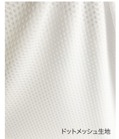
ドットメッシュ生地

イタリア製の高性能スポーツ生地です。UV 機能も備え基本的な吸汗速乾性も優れており空気の抜けも良い生地です。