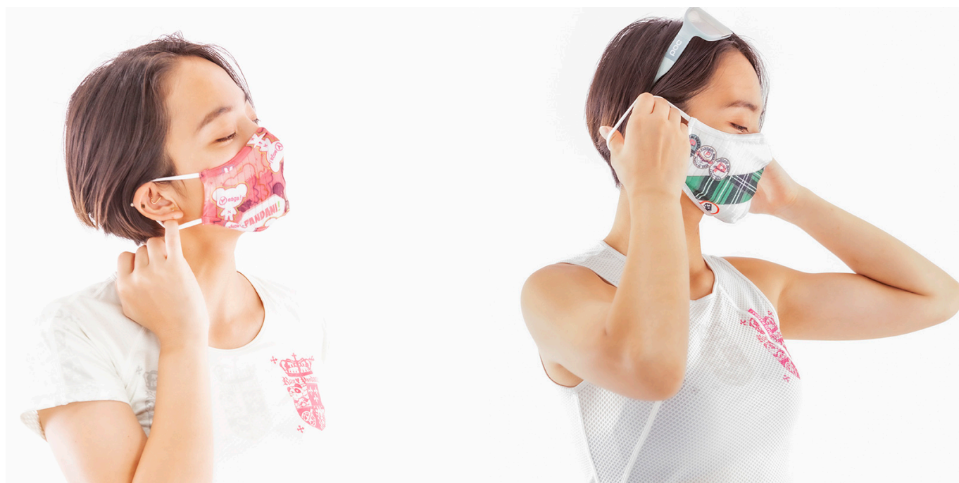
Vengal Wappen Printed MASK/PINK