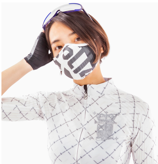
NUMERO Printed MASK/WHITE

イタリア製のスポーツ生地を表面に、内側には夏仕様のメッシュ生地を使って通気性をさらに向上させました。呼吸のしやすさはスポーツ時はもちろん普段使いでも長時間装着したくなるものです。最新の物は紐調節も付きストレスフリーな仕上がり。マスクの軽さも特筆物でSサイズはなんと7.9gと装着していることを忘れさせる程です。最新のデザインは和柄モチーフやTATOO柄など多彩な展開です。見て楽しく装着して軽くて通気性の良いマスク、スポーツメーカーならではの快適性をお試しください。