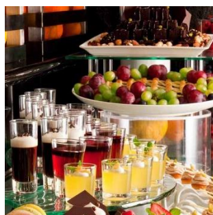
【3】食事スタート前の 「撮影タイム」