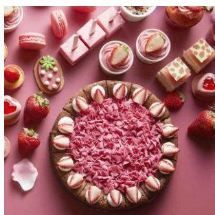
【1】25種類の 「新作いちごスイーツ」