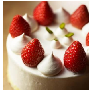
【4】おひとりさま歓迎& ティータイムに嬉しいお土産も

注目は、野菜のルバーブの香りと酸味を活かしたジャムをタルト生地とともに焼きこんだ「ストロベリールバーブタルト」、焼きたてを提供する「ストロベリークリームブリュレ」など。