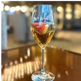
【2】当日限定 「いちごモクテル」