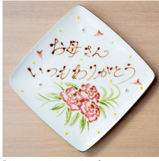
▲写真左から) 西麻布しるく屋、日本料理「花むさし」/ホテルメトロポリタン