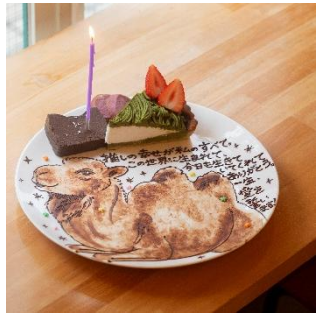
▲写真左から) リストランテ マンジャレ 伊勢山、GALLERY & CAFE CAMELISH