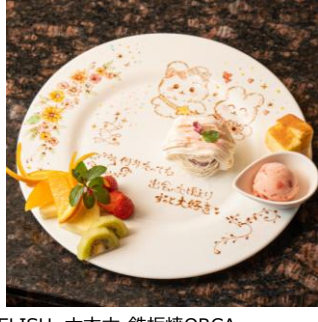
▲写真左から) GALLERY & CAFE CAMELISH、六本木 鉄板焼ORCA