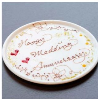
▲写真左から) 渋谷ワイナリー東京、イルビノーロ スカイテラス