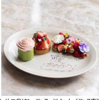
▲写真左から) キュイジース「エスト」/ホテルメトロポリタン、ジャヌ メルカート/ジャヌ東京