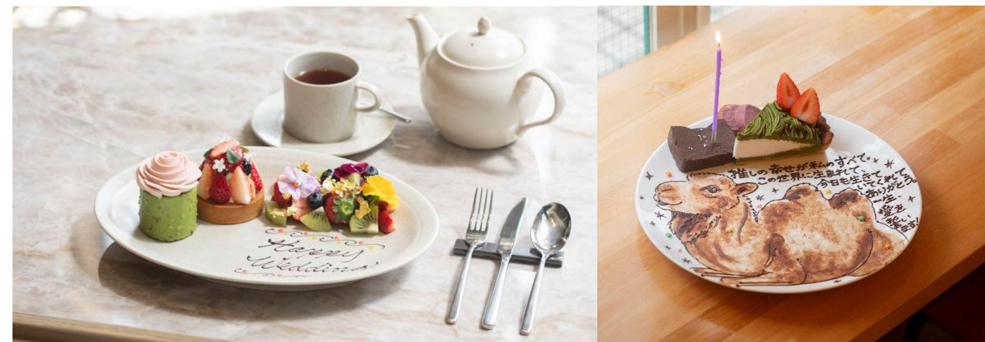
写真左から) ジャヌメルカート/ジャヌ東京、GALLERY&CAFE CAMELISH

■「メッセージプレート」特集はこちら https://www.ozmall.co.jp/restaurant/kodawari/withmessage/