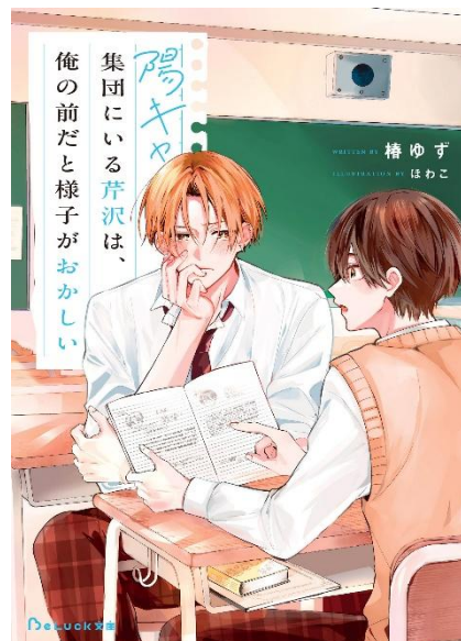
原作小説：「陽キャ集団にいる芹沢は、俺の前だと様子がおかしい」 (BeLuck文庫) ©椿ゆず・ほわこ/スタートズ出版