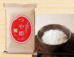
山形県産米 つや姫