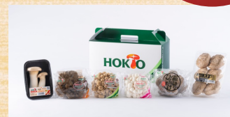
生鮮きのこセット (6種)