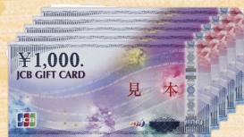
JCBギフトカード5,000円分