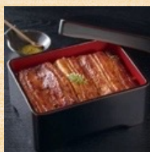
江戸前うなぎ蒲焼