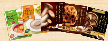
菌活レトルトセット(5種10品)