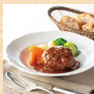
松阪牛煮込みハンバーグ