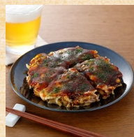
広島焼き パラエティセット