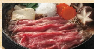
黒毛和牛 すき焼用