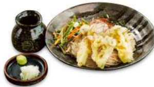
きのこ天ぷら ぶっかけ蕎麦 ¥2,200(税込) ※各日20食限定となります。

夏に嬉しいビタミン・ミネラルの豊富なきのこことアミノ酸の豊富な蕎麦の組み合わせで、夏の疲れを癒します。