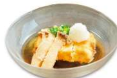
揚げ出し豆腐の エリンギ添え ¥800(税込) ※各日10食限定となります。

低カロリーで食べ応えのあるきのこ豆腐を使ったヘルシーな一品。揚げ出しにすることで大満足の一品に♪