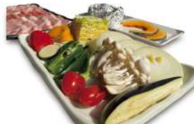
軽井沢ブラン ¥4,800(税込)

きのこに豊富な「代謝ビタミン」のビタミンB群とお肉のタンパク質でスタミナチャージ！夏の元気を後押しします♪