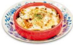
5種のキノコと ハンバーグのドリヤ ¥2,200(税込)

ビタミンB1の豊富なきのこのこと、タンパク質の豊富なハンバーグでスタミナアップ！夏の元気を応援します♪