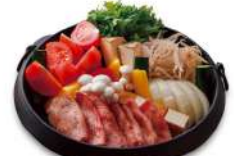
トマトときのこ 黒毛和牛のすき焼き ¥18,000(税込) ※別途サービス料を13%加算いたします。

ビタミンB群を含むきのこことタンパク質が豊富な肉を組み合わせた、満足感のある一皿。夏にうれしいしっかりとした食べごたえでお楽しみいただけます。