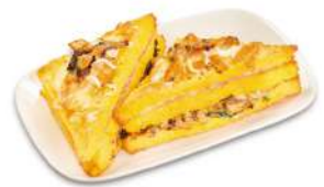
シャンピニオン ¥530(税込) ※数量限定となります。

きのこに豊富な免疫維持に役立つ「βグルカン」と玉ねぎの殺菌成分「硫化アリル」の組み合わせで免疫維持を後押し！