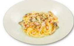
5種のキノコとベーコンの クリームパスタ ¥1,980(税込)

きのこには睡眠の質を保つオルニチンが豊富。きのこの旨味とクリームの味わいでホッと一息つける一品です。