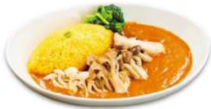
きのこカレー ¥1,600(税込) ※数量限定となります。

きのこに豊富なビタミンB1は、ごはん豊富な糖質を代謝してエネルギーに変えることで夏のスタミナを応援します。