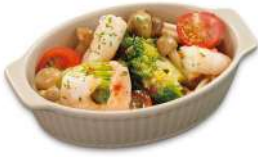
信州産きのこ エビのアヒージョ ¥880(税込)

きのこのオルニチンとエビのアスタキサンチンが良質な睡眠をサポート！オルニチンはアルコールケアにも役立ちます♪