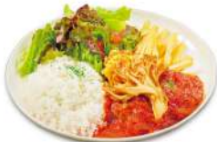
ハンバーグプレート ～舞茸とトマトソース～ ¥1,925(税込) ※数量限定となります。

きのこに豊富で強力な抗酸化成分の「エルゴチオネイン」とトマトの「リコピン」が夏の美容ケアを強力にサポート♪