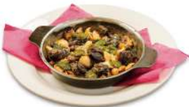
エスカルゴとキノコの オープン焼き ¥1,900(税込)

きのこのビタミン・ミネラルとエスカルゴのタウリンが暑い夏の疲れを癒す一品。きのことニンニクの香りで食欲もアップ♪