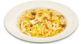
きのこ野菜の ペペロンチーノ ¥1,595(税込)

きのこに豊富な食物繊維が「健康の要」の腸を整えて夏の元気を応援♪きのこのうま味とニンニクの香りが食欲をそそる！