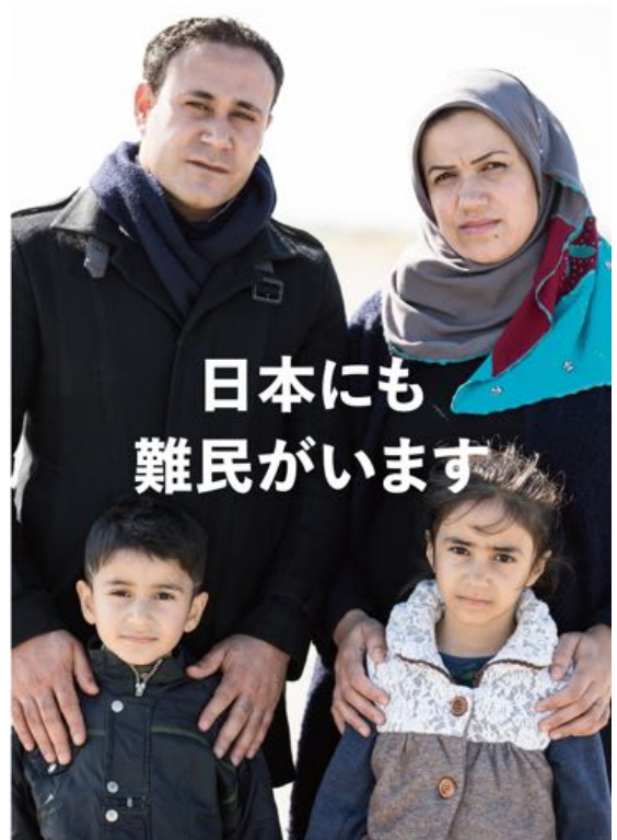
昨年2016年実施 難民支援キャンペーン メッセージビジュアル

・「#No Borders」 https://jn.lush.com/article/noborders