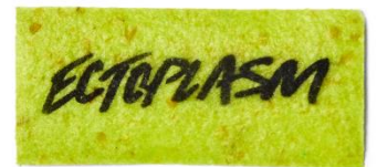
エクトプラズム ウォッシュカード (ウォッシュカード)