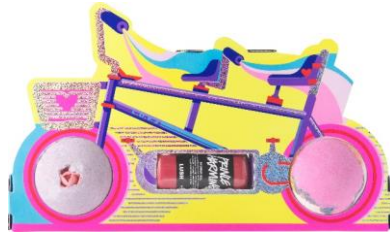
ジョイライド (ギフト)

ギフト内容・・・プリンスチャームング(シャワージェル)、マシュマロ ワールド(バスボム)、セクシー・ダイナマイト(バスボム) 大好きな人のためにスペシャルシートを用意して、ハッピーなバスタイムへのサイクリングを楽しみましょう。心ときめくピンクカラーのシャワージェルと2種類のバスボムがイン。ザクロ、バニラ、ジャスミンの素敵な香りをまとうせるアイテムで贅沢なバスタイムを満喫してください。こちらの商品は贈り物用に選んだ商品を包むギフトラッピングアイテム単品としてもご購入いただけます。