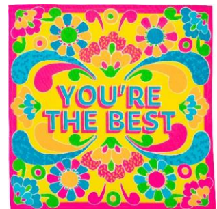
ユア ザ ベスト ノット ラップ (70cm x 70cm)

大好きな人のことをどれだけ大切に思っているか分かってほしいなら、明るく華やかなオーガニックコットン製のKnot Wrap(風呂敷)でこのメッセージを伝えてください。きっと、この一枚の布に託したあなたの想いはあの人の心に永遠に残るでしょう！