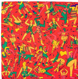
レッツ ゲット フィジカル ノット ラップ (70cm x 70cm)

私たちはエクササイズが体も心もヘルシーなライフスタイルに役立つと知っています。大好きなあの人と親しい関係にレベルアップしたいなら、このユニークでちょっとセクシーなKnot Wrap(風呂敷)でバレンタインギフトをプレゼントして愛のワークアウトに励みましょう！