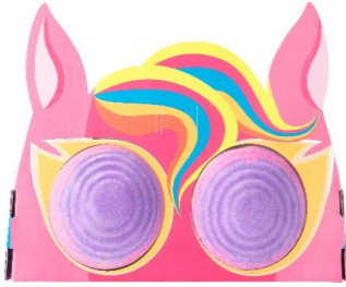
ユニコーン (ギフト)

バレンタイン限定を含むギフトアイテム全5種、「Knot Wrap」(ノットラップ)などを含むギフトラッピングアイテム全6種を販売開始します。ギフトの持つ可愛さはそのままに、全ての資材がリサイクル素材で作られています。また、中身を使用した後は、お面や部屋に飾るインテリアなど自由な発想でリユースして楽しみいただけます。