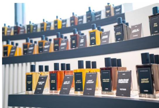
LUSH 新宿店 パフューム 라이브ラリー

新宿店WEBサイト: https://jn.lush.com/shop/shinjuku