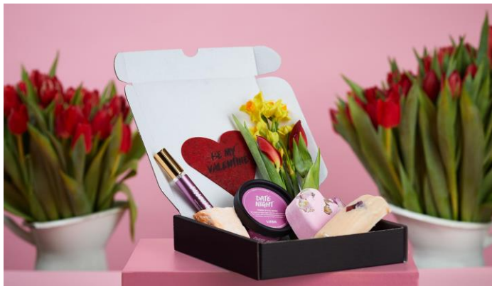
『フレッシュ&フラワー ボックス』イメージ画像

*サブスクリプションサービス『フレッシュ&フラワー ボックス』: 月額¥5,000(税込・送料込)で出来立てのコスメとオーガニックフラワーを毎月お届けする2021年7月より開始したサービスです。