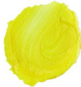
セレブレーションフォーミングボ ディスクラブ (フォーミングスクラブ) ¥2,400 (税込)/ 130g

カラフルなドラゴンを作った後は、ソープ、シャンプー、泡風呂をつくれるバブルバーとして楽しめます。レモンとベルガモットの軽やかですっきり爽やかな香りに包まれたバスタイムは、まるでドラゴンの翼を得たかのような楽しい気分。お肌や髪に潤いを閉じ込めて、触り心地を柔らかくする働きのあるグリセリンとお湯の質感をまろやかにするコーンスターチを配合しています。