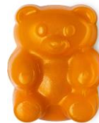
ガミーベア (シャワーゼリー) ¥1,000 (税込)/ 85g

スイカの甘く爽やかな香りときときめく虹色のルックスは毎日のバスタイムがもっとハッピーになりそうな予感です。ビタミンAやCを含むスイカの果汁を配合、お肌の水分保持をサポートします。パームオイル不使用の石ケン素地の一部には米ぬかオイルを原材料にしています。ビタミンB群やセラミドを含む米ぬかオイルが洗い上がりのお肌をしっとり健やかにキープします。