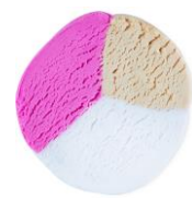
アイビリーブユニコーンズ (ファン) ¥1,500 (税込)/ 200g

イースターバニーの大好物のニンジンが虹色のバブルバーになって新登場。7色揃っているの、お気に入りの色を選んでお風呂のお湯をカラフルに彩るのがおすすめです。トロピカルな香りです。繰り返して使えるリユーズブルタイプのバブルバーです。