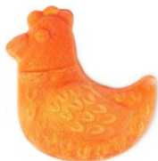
ヘニーペニー (バブルバー) ¥940 (税込)/ 100g

ベルガモットとフランキンセンスのフルーティーでもありながら神聖な香水のような香りの泡風呂は、臆病な気持ちを吹き飛ばし明るい気分にしてくれそうです。お肌の調子を整えるドングリパウダーを配合。