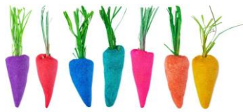
ベイビーレインボウベジ (バブルバー) ¥500 (税込)/ 40g

ベルガモットとフランキンセンスのフルーティーでもありながら神聖な香水のような香りの泡風呂は、臆病な気持ちを吹き飛ばし明るい気分にしてくれそうです。お肌の調子を整えるドングリパウダーを配合。