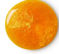
ゴールデンエッグ シャワージェル (シャワージェル) ¥1,200 (税込)/ 115g

シュワッと泡立つ不思議なボディスクラブは、コメ粉のスクラブがくすみの原因になる古い角質や汚れを落とします。重曹とクエン酸が配合されているので、水分を含んだ時にシュワッと発泡し、肌触りを柔らかくします。また、ビタミンEを豊富に含むサンフラワーオイルが潤いのある柔らかなお肌にし、油分と水分のバランスのとれた健やかなお肌を保ちます。スイートオレンジとライムの華やいだ香りの楽しいボディケアタイム。