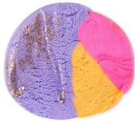
ヒアゼアビードラゴンズ (ファン) ¥1,500 (税込)/ 200g

永遠の幸福をもたらす、魔法の力を持ったユニコーンを粘土で作って遊んだ後は、ソープ、シャンプー、そしてこもこの泡風呂としても楽しめるアイテムです。季節の変わり目で乾燥しやすいお肌や頭皮をグリセリンがしっとり柔らかくします。ベルガモット、ダバナ、ジャズミンをブレンドした香りは、キャンディのような甘さと大人びた花のアロマが絶妙にマッチしています。