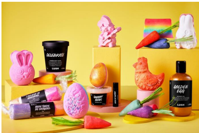
イースターコレクションのイメージ画像

英国発のナチュラルコスメブランドLUSH(ラッシュ)は、全国77店舗と公式オンラインストアにて2023年3月1日(水)よりイースターコレクション全21種(バスボムやソープなど単品14種、ギフト4種、Knot Wrap3種)を発売いたします。子沢山のウサギは「新しい命」や「繁栄」を意味することから、「復活祭」と呼ばれるイースターの象徴となっています。今年のコレクションはウサギをモチーフとしたバスボム(入浴料)やソープ、ウサギたちの大好物ニンジンがレインボーカラーのバブルバー(泡風呂用入浴料)になりラインナップ。イースター(4月9日)は、愛嬌たっぷりのウサギたちと一緒にぴよんとバスタブに飛び込んでバスルームで春の訪れをお祝いしましょう。